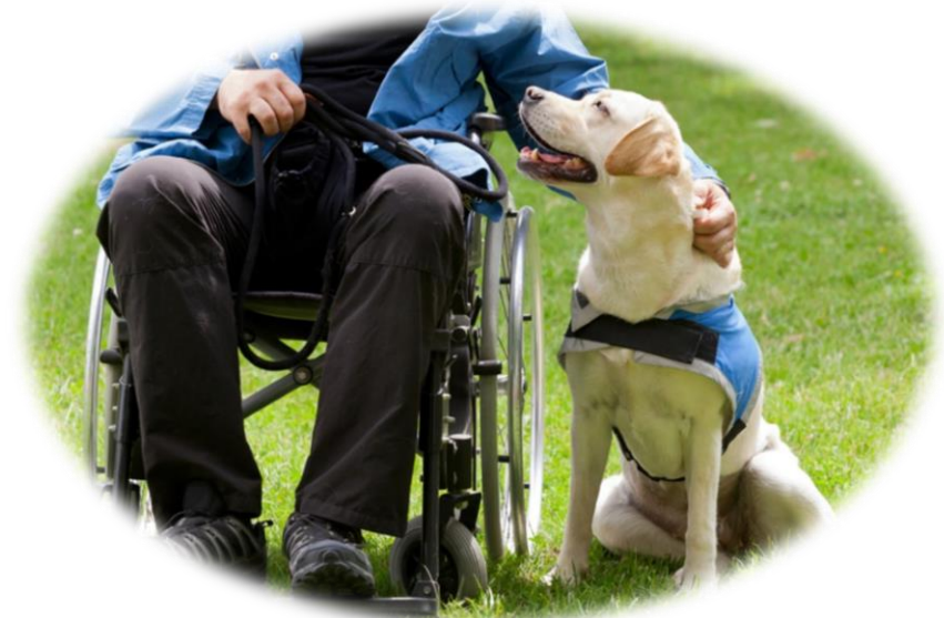
Asistencia y terapia