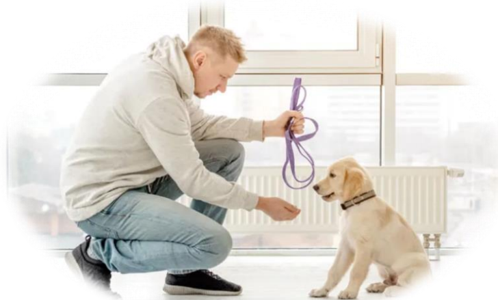
Adiestramiento en obediencia básica