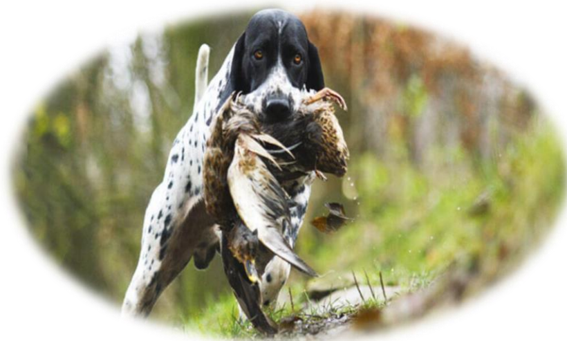
Adiestramiento para funciones especiales