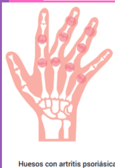
Huesos con artritis psoriásica