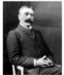
Edward Bradford Titchener

Para el funcionalismo la conciencia tiene la finalidad de ser un instrumento de adaptación del organismo al medio ambiente y solo desde esa postura debe ser estudiada por la psicología