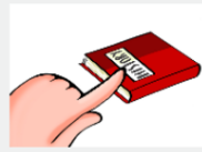
This book Este libro