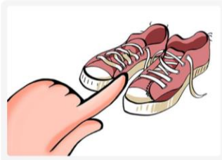
These shoes are old.

Se usa cuando hablamos de más de un elemento que se encuentra a poca distancia del hablante.