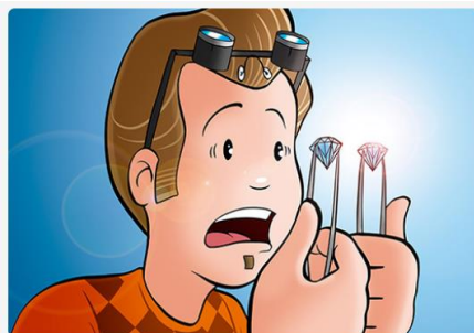
These are original. Estos son originales.