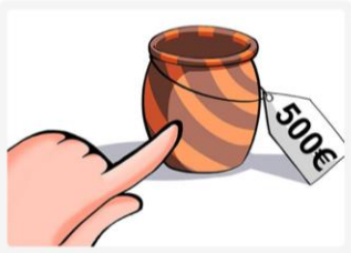
This vase is very expensive.

Se utiliza cuando hablamos de un solo elemento que se encuentra a poca distancia del hablante.