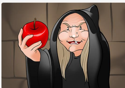
This apple is mine. Esta manzana es mía.

Cuando el demostrativo aparece acompañado de un nombre, se categoriza como un adjetivo porque especifica el elemento del que estamos hablando.