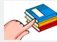
These books Estos libros

También utilizamos los determinantes demostrativos cuando introducimos a alguien o preguntamos por alguien a través del teléfono, utilizando las construcciones This is.../These are respectivamente: