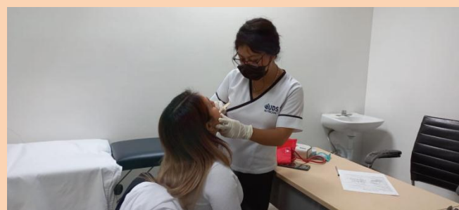
Realizando exploración física