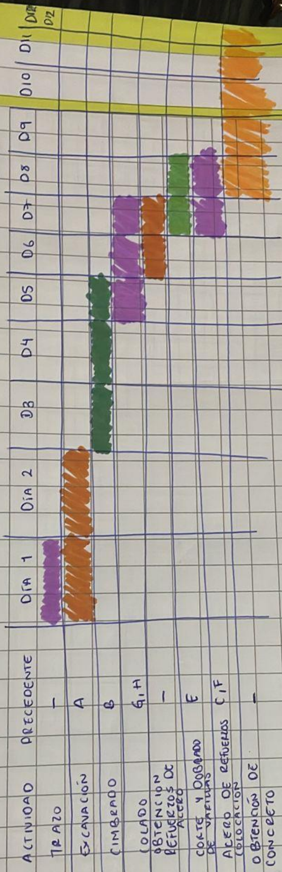
DIAGRAMA DE GANTT