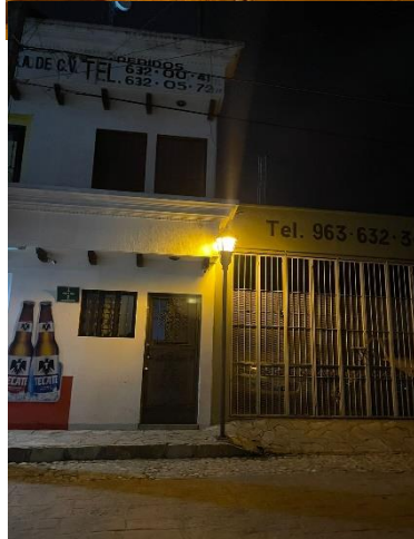
Poste de alumbrado 6 mts cilíndrico 3 plg diam con dado piramidal en piso y luminaria colonial con lampara vapor de sodio 70 watts 220 volts