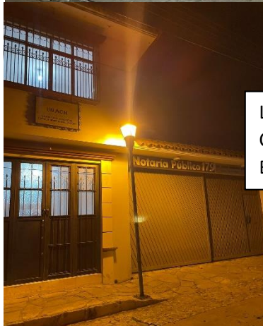
LADO IZQUIERDO COMENZANDO DE BOULEVARD