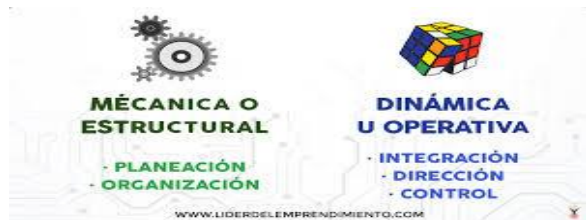
Fases del proceso administrativo

El proceso administrativo se separa en 2 fases: Mecánica y Dinámica