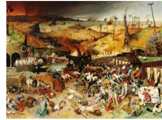
'El triunfo de la muerte'.