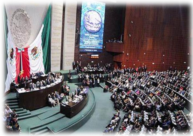
LEYES SECUNDARIA FRACC II