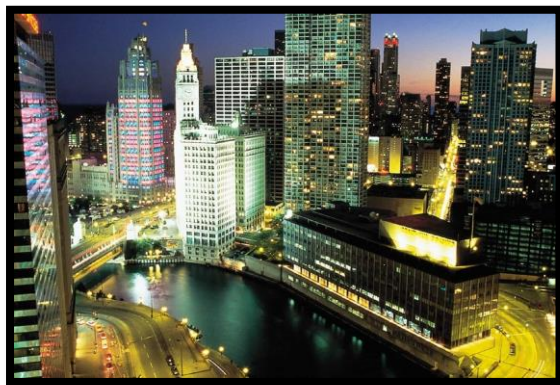
CENTROS URBANOS FRACC VI