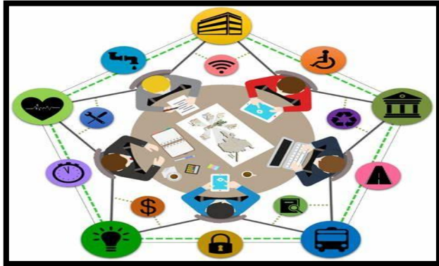
PLANES DE DESARROLLO FRACC V