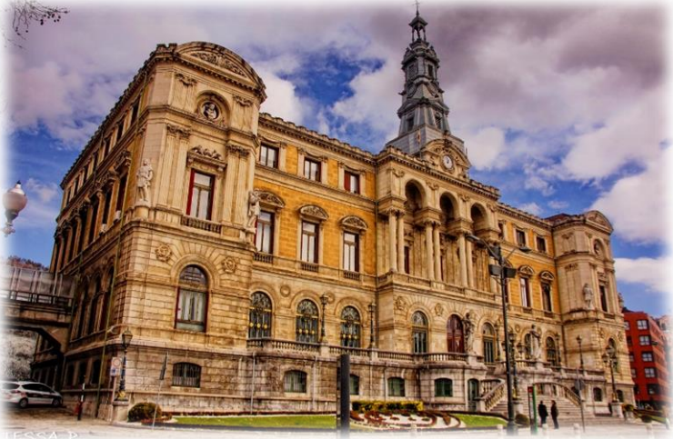
AYUNTAMIENTO FRACC I