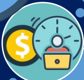
Horas extras dobles

La jornada de emergencia se da en el supuesto de la prolongación de la jornada ordinaria a causa de un siniestro o riesgo que peligre la vida del trabajador, de sus compañeros