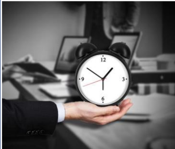
La jornada de trabajo

De acuerdo con el artículo 58 de la LFT "es el tiempo durante el cual el trabajador está a disposición del patrón para prestar su trabajo"