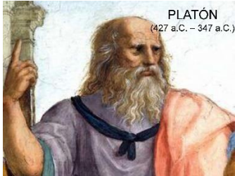
PLATÓN (427 a.C. - 347 a.C.)

PLATON Construyó su teoría del Mundo de las ideas, causas de tipo físico y mecánico