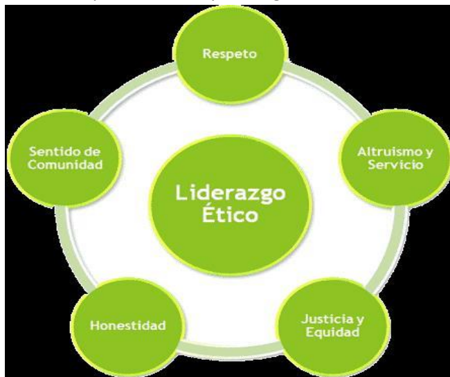
Cualidades y características del líder

El liderazgo ético se basa en la capacidad del líder de enfocar la atención de la organización en la ética y los valores y de inculcar a la organización los principios que orientarán las acciones de todos los empleados. La ética profesional significa laborar con vocación de servicio, con integridad intelectual, moral y física para que la profesión sirva a la comunidad donde es importante el fin pero también los medios que se utilicen para llegar a él.