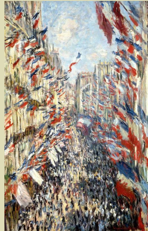
La calle Montorgueil Claude Monet