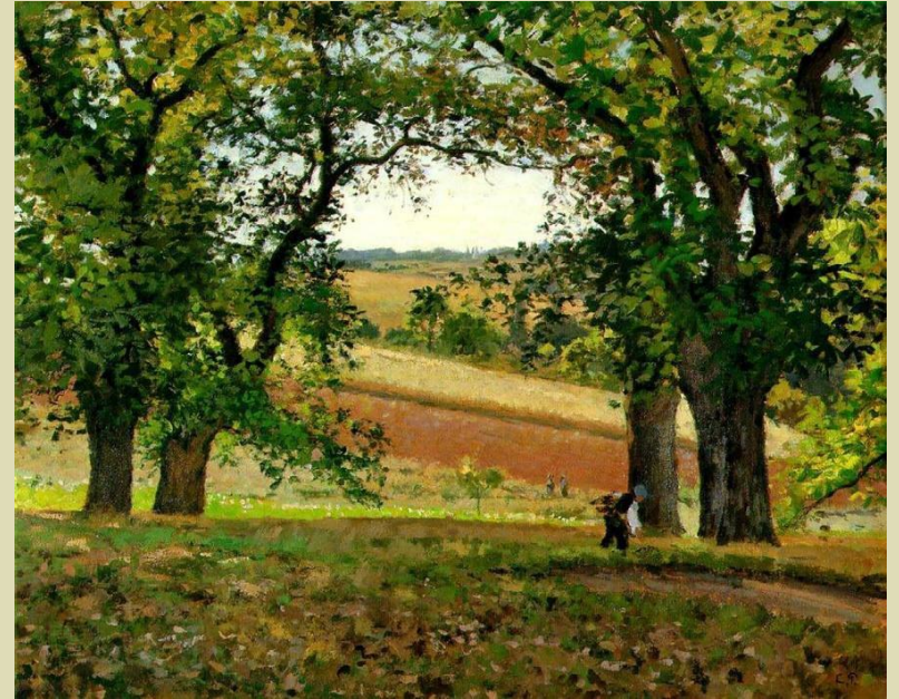
Los castañeros de Osny Camille Pissarro