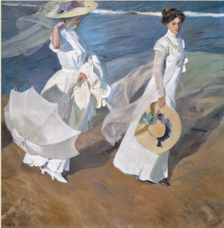
Paseo a orillas del mar J.M.W. Turner