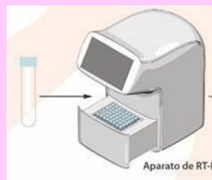
TÉCNICA DE RT-PCR