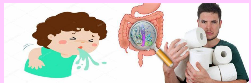
VÓMITOS Y DIARREA, AUNQUE ESTO ES MÁS COMÚN EN LOS NIÑOS QUE EN LOS ADULTOS.