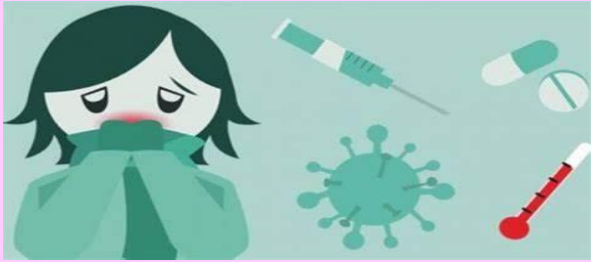
FIEBRE O SENTIRSE AFIEBRADO/CON ESCALOFRÍOS