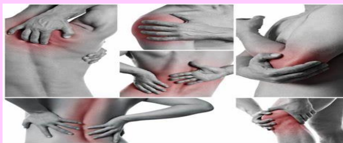
DOLORES MUSCULARES O CORPORALES