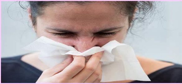
SECRECIÓN O CONGESTIÓN NASAL