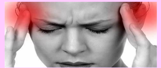
DOLORES DE CABEZA