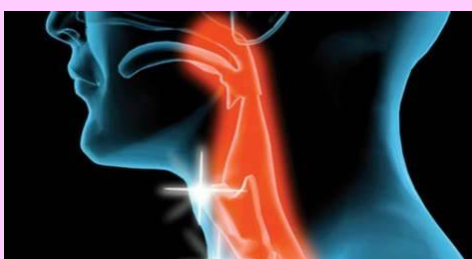
CONGESTION MUCOSA OROFARINGEA