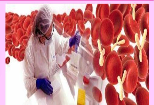
INHIBICIÓN DE LA HEMAGLUTINACIÓN