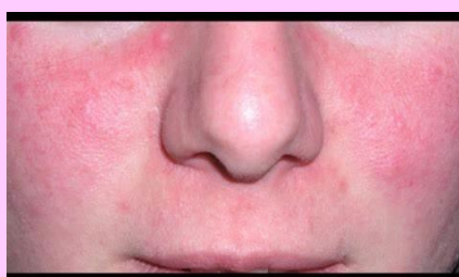
ENROJECIMIENTO PIEL (CARA)