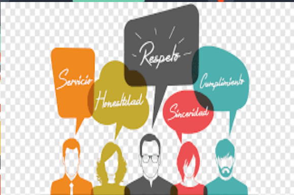
Imagen de algunos valores.

Es el elemento en el que se logra la realización efectiva de todo lo planeado por el administrador ejercida a base de buenas decisiones. Y establece: