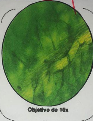
Objetivo de 10x