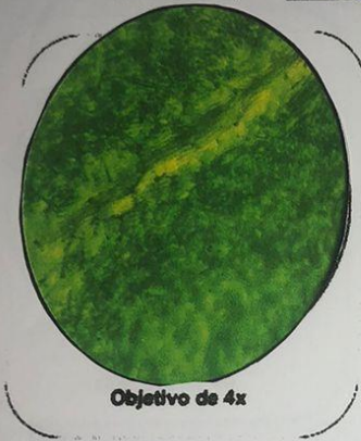
Objetivo de 4x

Nombre del objeto: hoja verde de geranio