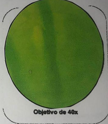
Objetivo de 40x

En primera instancia podemos notar ligeramente una ramificación o venas de la hoja de geranio.