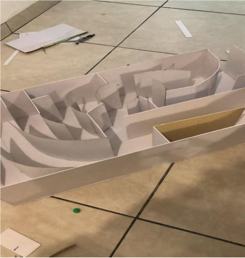
Elaboración del laberinto