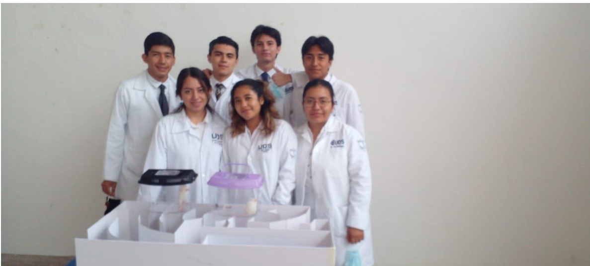
INTEGRANTES DE EQUIPO