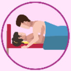
Relaciones sexuales sin protección

Las causas de las ETS pueden ser bacterias, virus y parásitos.