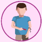
Intercambio de agujas