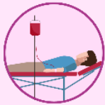
Transfusión de sangre