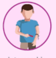
Intercambio de agujas