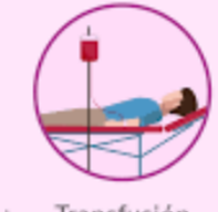
Transfusión de sangre