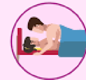
Relaciones sexuales sin protección

¿Cómo se transmite? Al tener relaciones sexuales vaginales, anales u orales con alguien que tenga alguna ETS.