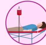
Transfusión de sangre