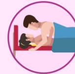
Relaciones sexuales sin protección