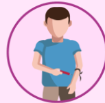
Intercambio de agujas