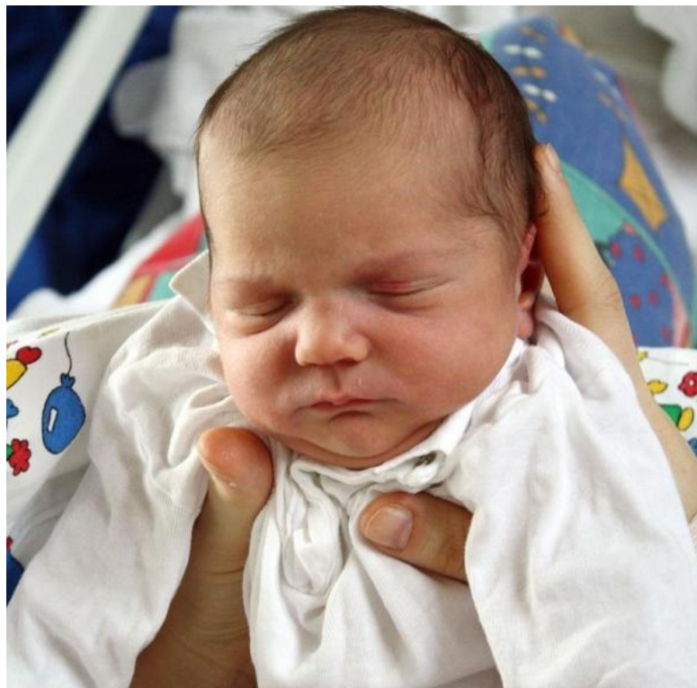
Una fotografía de Slora.

Esta pequeña parte ya no tiene nada que ver, pero le quería mostrar que con amor, cuidados intensivos y recurso monetario mi pequeño Slora del solar, está llevando una vida digna y saludable.