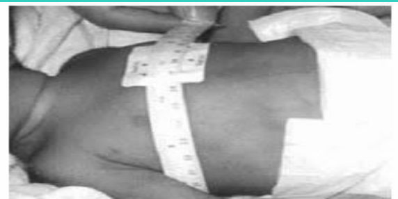
Figura 8. Perímetro del tórax.

Parámetro torácico: También se realiza con una cinta métrica para saber la circunferencia del tórax.