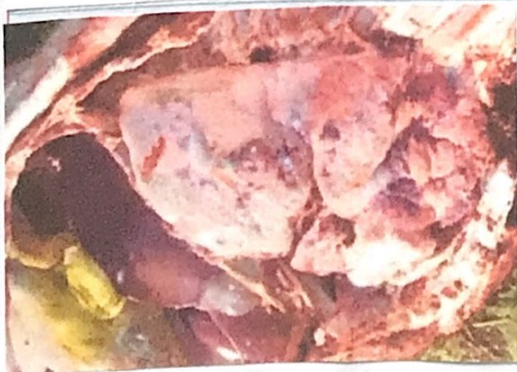
Fig. 27.- Encéfalo recubierto por la aracnoides con LCR.

Cavitación de órganos (timo principalmente)