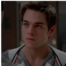
Liam Dunbar "Teen Wolf"