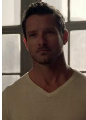
Peter Hale "Teen Wolf"