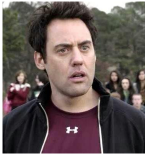
Bobby Finstock (Entrenador) "Teen Wolf"