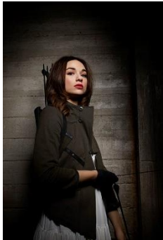
Allison Argent "Teen Wolf"