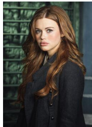
Lydia Martin "Teen Wolf"