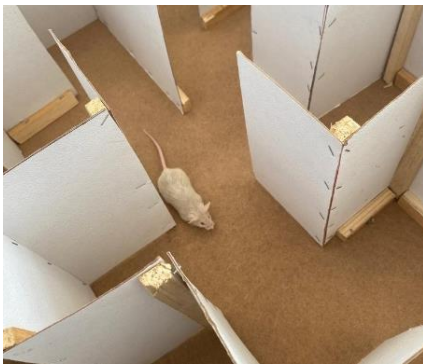
RATA B EN LABERINTO