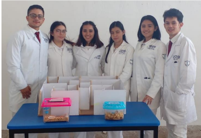
FOTO DEL EQUIPO