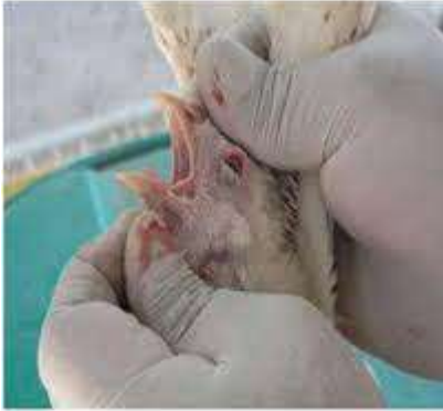
Figura 4. Inspección Clínica: inspección de lengua y cavidad oral.

NECROPSIA EN AVES: Es la disección anatómica rápida ordenada y sistemática para la revisión de un cadáver por aparatos y sistemas