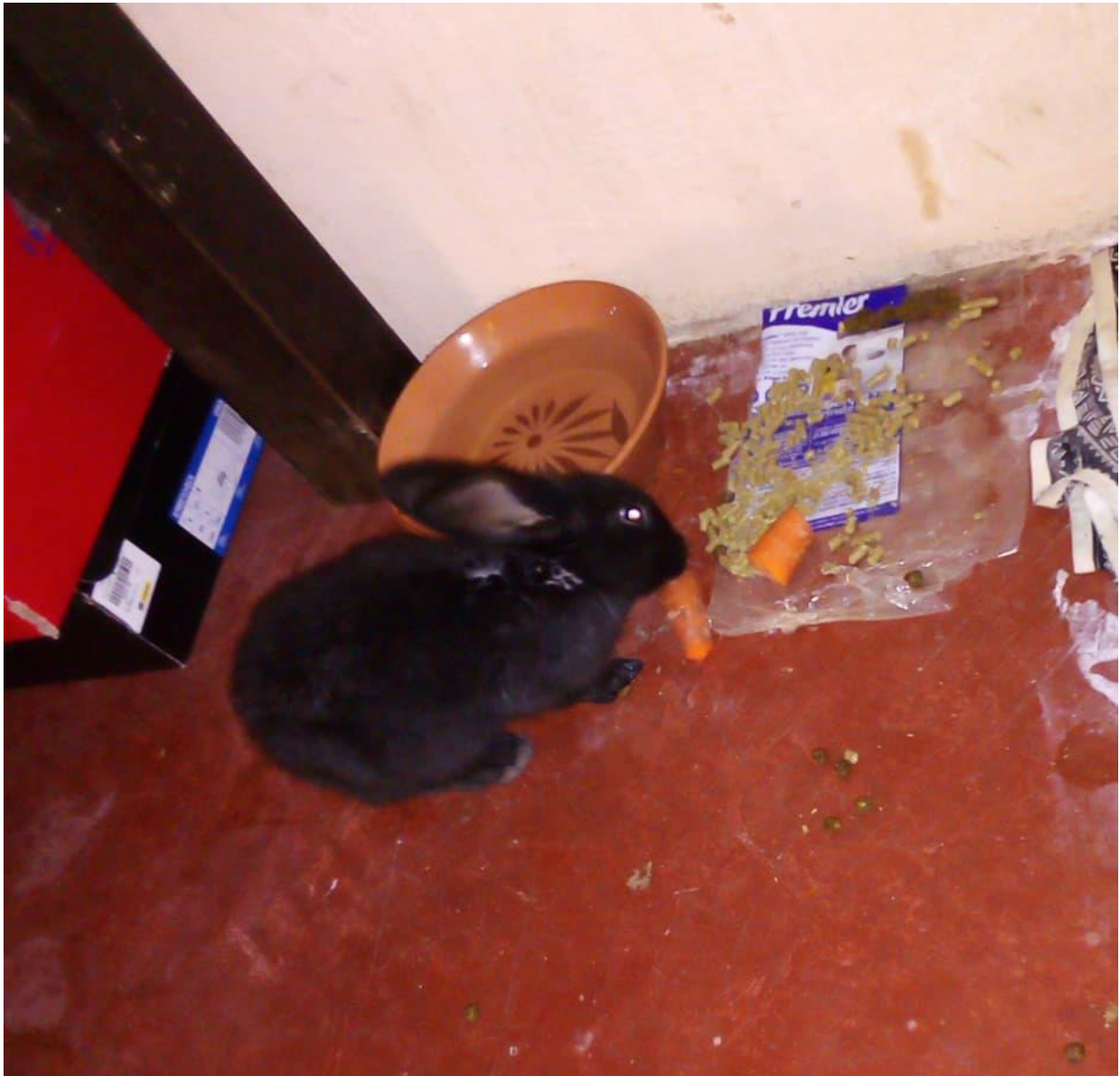
Ilustración 1alimentacion 20 de julio 2022