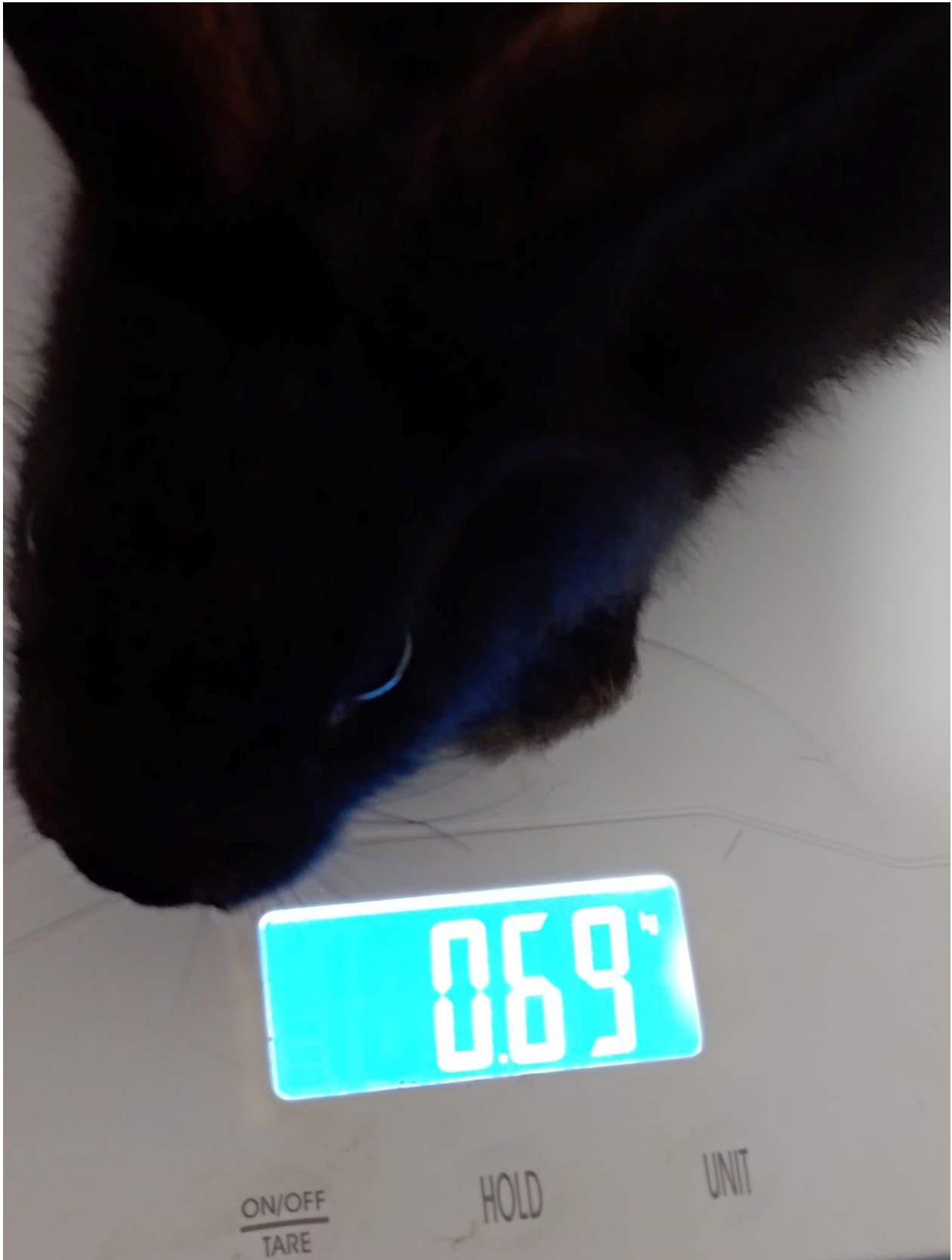
Ilustración 3Peso del 29 de julio 2022