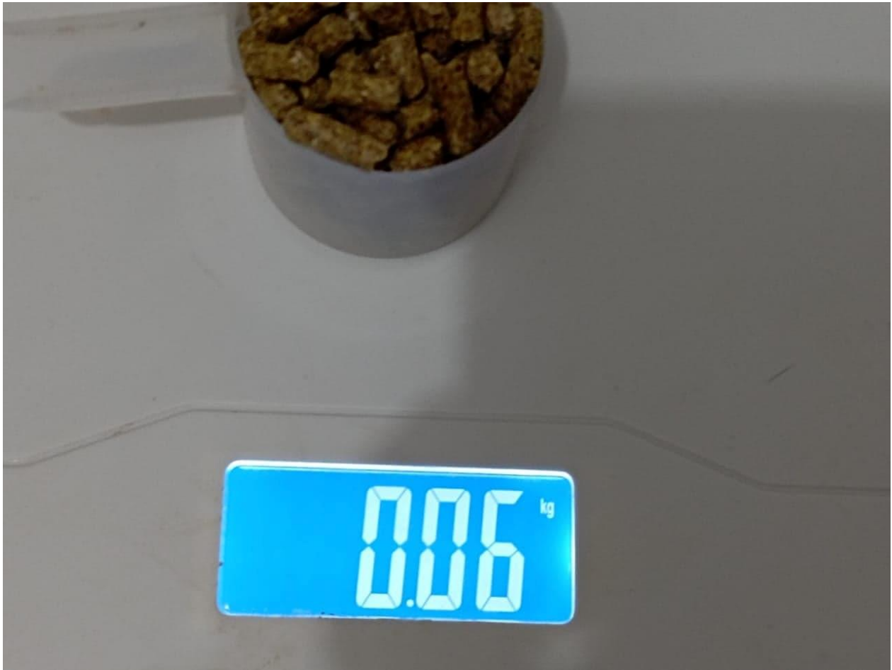
Ilustración 2 Peso del alimento mínimo diario