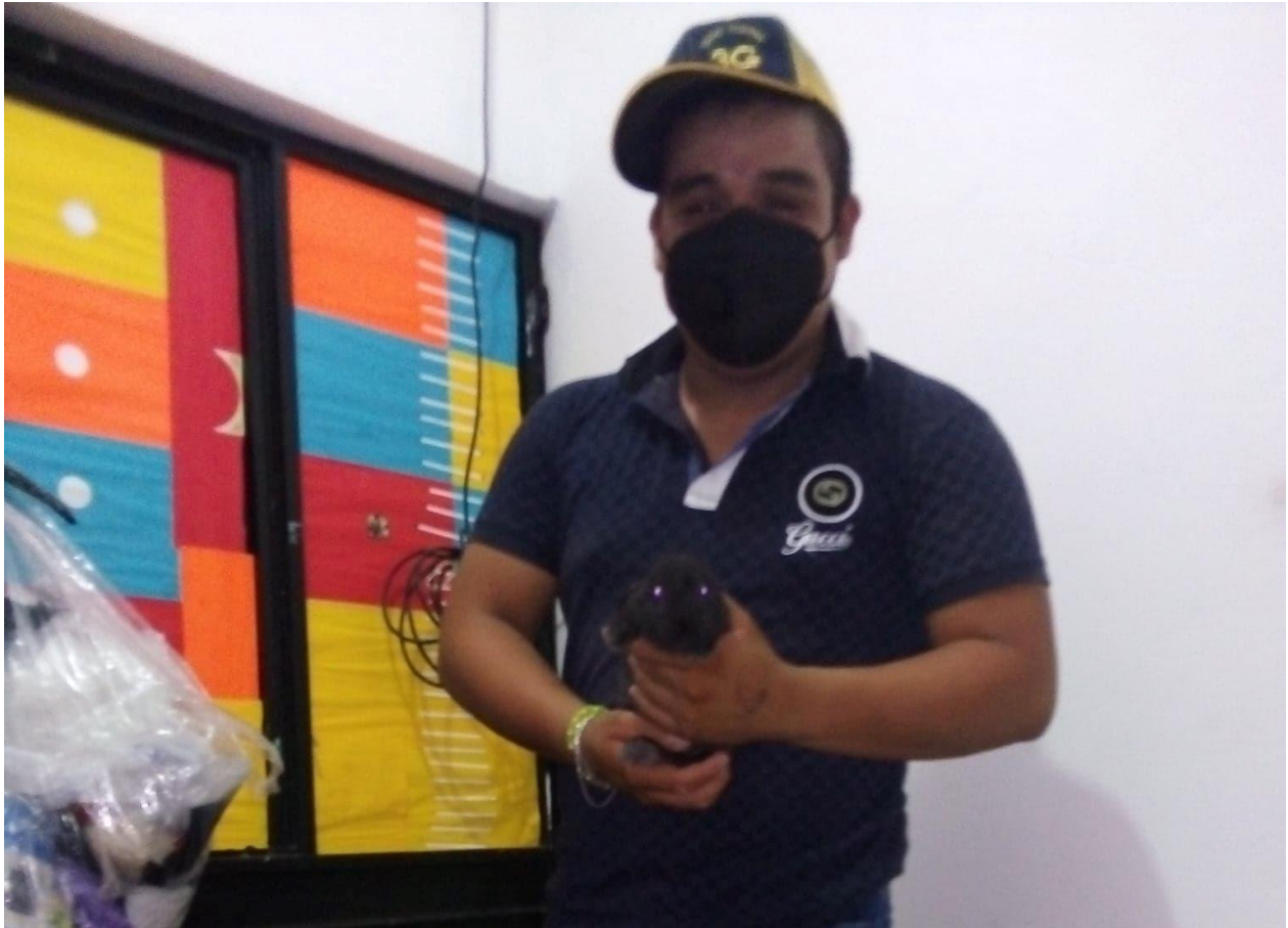
Ilustración 5 Angel Guillen