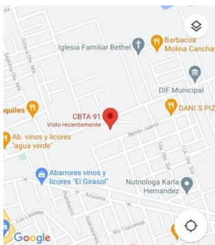
Ilustración 2 Ubicación CBTA91