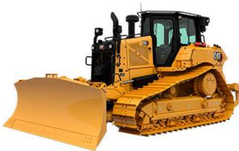
TRACTOR DE ORUGAS