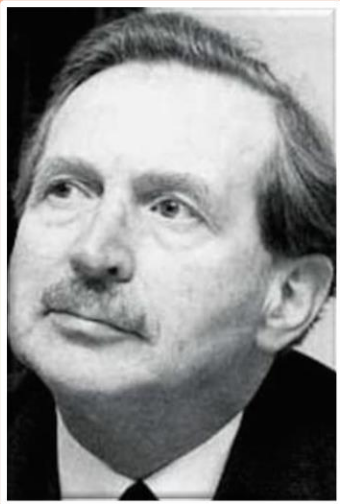
Edgar Anstey en el año de 1955.

La primera (1944) quedo restringido su uso al ejercito británico.