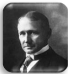
FREDERICK W. TAYLOR