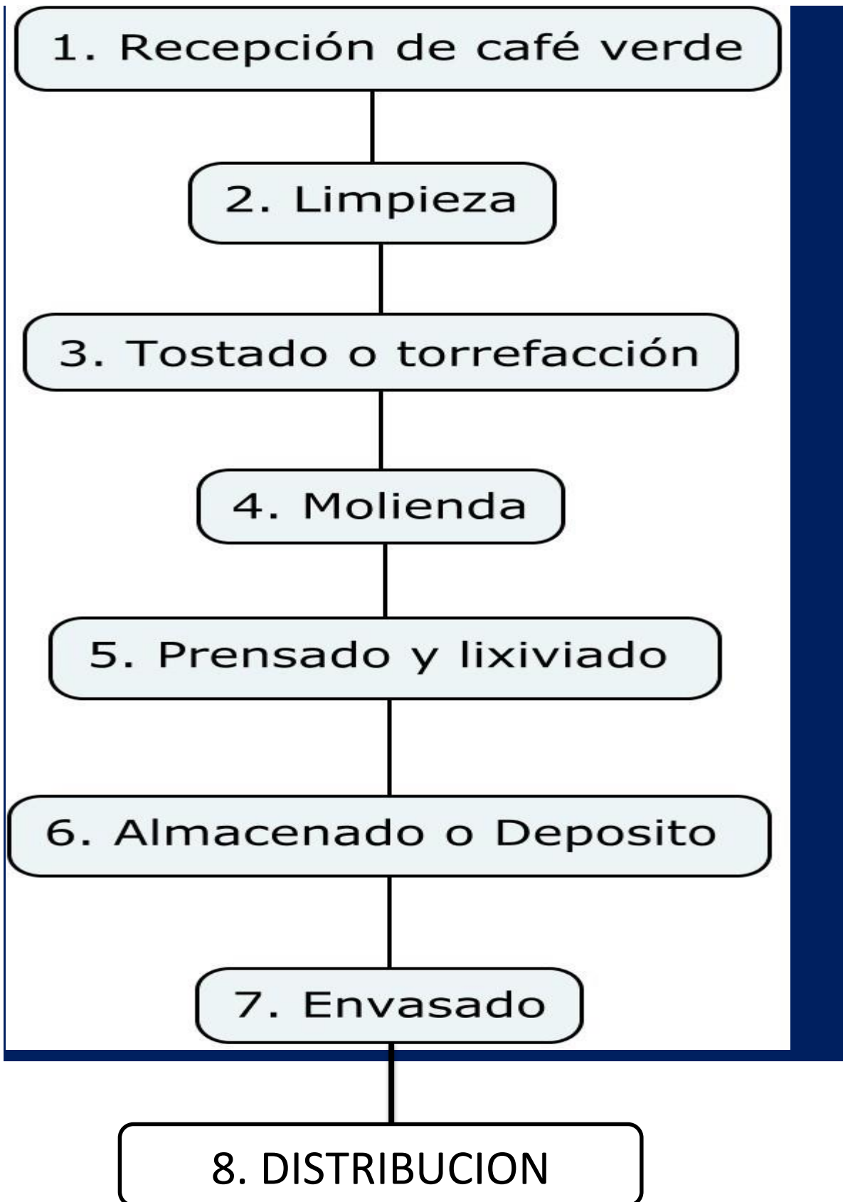
Diagrama del proceso del producto