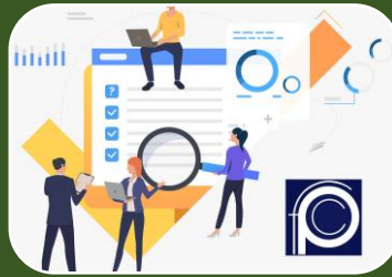
ATENDIENDO A LA SOCIEDAD EN GENERAL