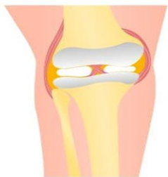
Articulación de la rodilla sana