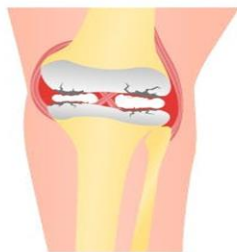
Articulación de la rodilla enferma