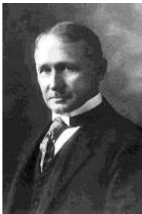
FREDERICK TAYLOR PADRE DE LA ADMINISTRACIÓN CIENTÍFICA