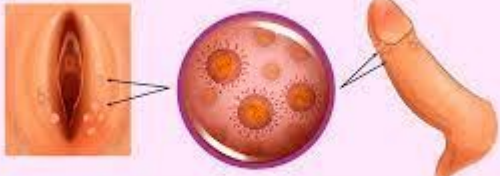
Virus del papiloma humano (VPH)