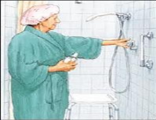
Baño en regadera o ducha

es el baño que se realiza en la ducha cuando la condición del paciente lo permite.