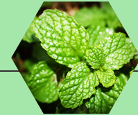
Hierbabuena - M. spicata

Ayuda a disminuir la fiebre, es relajante, ayuda al buen funcionamiento intestinal y reducir el dolor estomacal.