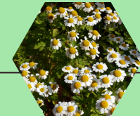
Manzanilla - Chamomilla recutita

Por sus propiedades medicinales es utilizada en el tratamiento de náuseas, vómito y trastornos gastrointestinales.