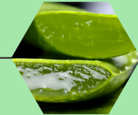
Sábila - Aloe barbadensis Miller

Sus infusiones se utilizan para tratar padecimientos como la fiebre, inflamación, espasmos musculares, trastornos menstruales, insomnio, úlcera, heridas, trastornos gastrointestinales, dolor reumático y hemorroides.