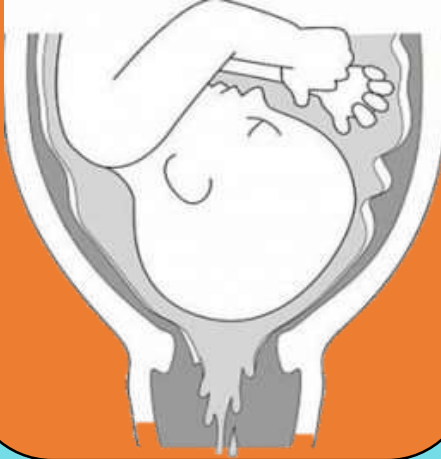
Rotura de Bolsa Amniótica