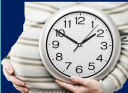
Amenaza de Parto pretermino