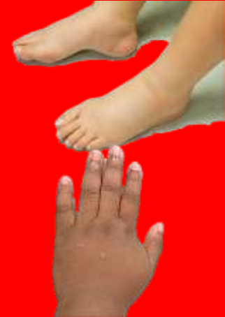
Edema de cara, manos y pies