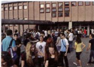
4. a school