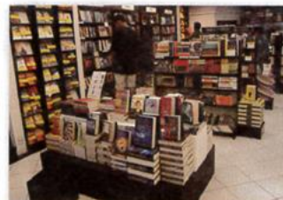
6. a bookstore

Exercise 1. Translate to Spanish the vocabulary above (Traduce al español el vocabulario de arriba).