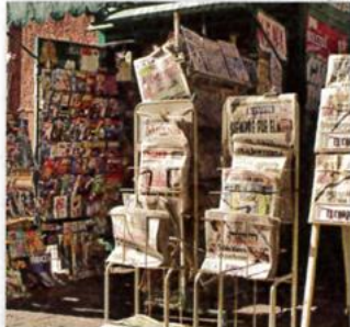
5. a newsstand