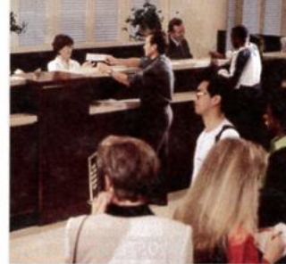
3. a bank