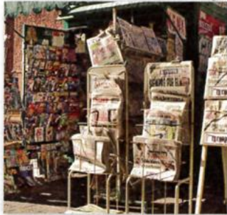
5. a newsstand