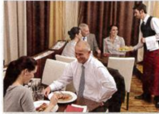
2. a restaurant