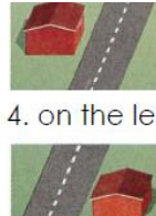
4. on the left