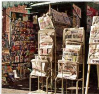
5. a newsstand