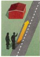
2. down the street