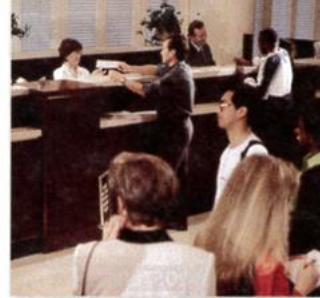
3. a bank