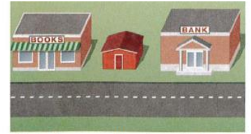
7. between the bookstore and the bank