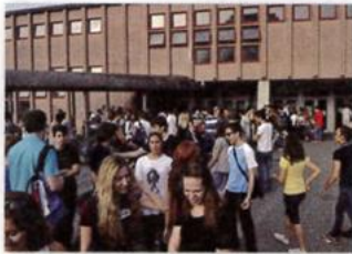
4. a school