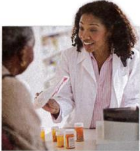
1. a pharmacy