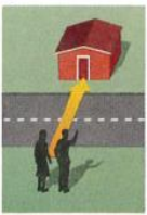
1. across the street