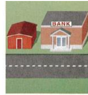
6. next to the bank