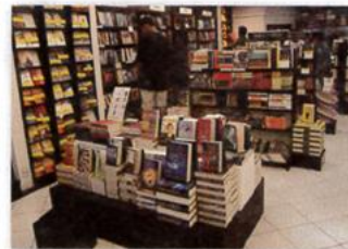
6. a bookstore

Exercise 1. Translate to Spanish the vocabulary above (Traduce al español el vocabulario de arriba).