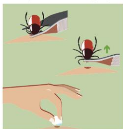
Método para la extracción de la garrapata

Las garrapatas son ectoparásitos del orden Ixodida, que se fijan sobre la piel y se alimentan de la sangre