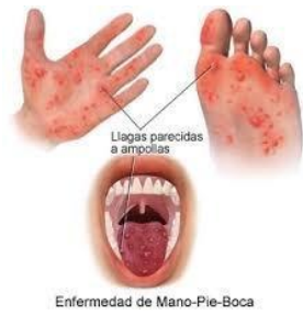
Enfermedad de Mano-Pie-Boca

Enfermedad de origen viral que afecta las bovina, equina, porcina, ovina y potencialmente al hombre, producida por un Rhabdovirus.