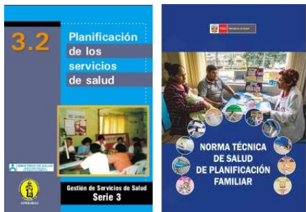
Buena planificación en el sitio