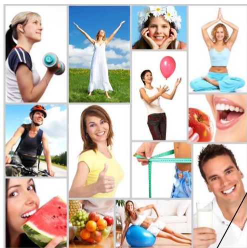
Estilos de vida