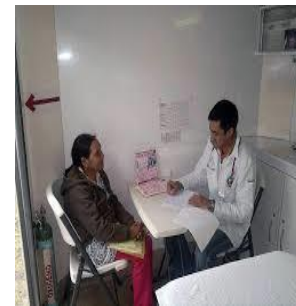
Provisión de servicios clínicos básicos