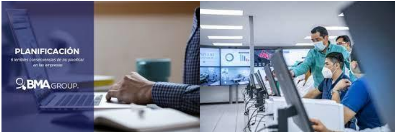
Planifica y evalúa los servicios de salud