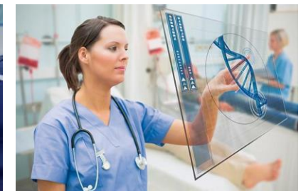
La evaluación de tecnología sanitaria