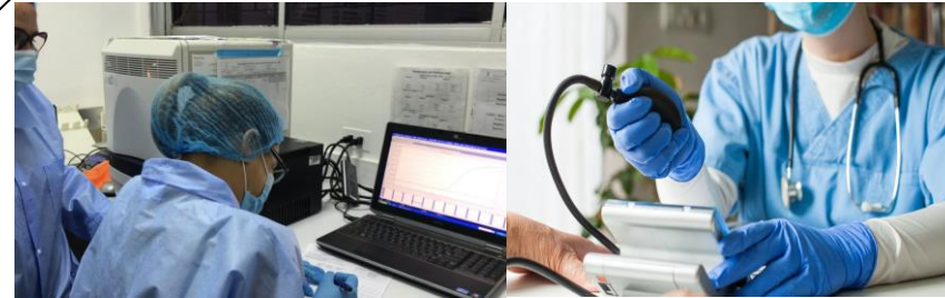
Control y prevención de enfermedades