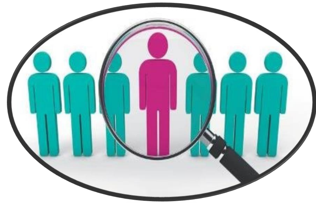
VIGILANCIA DE LAS ENFERMEDADES