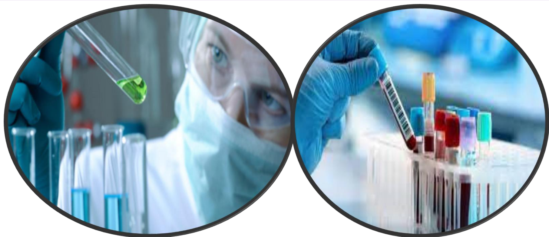
VALORACIÓN DE LAS PRUEBAS DE DIAGNÓSTICO