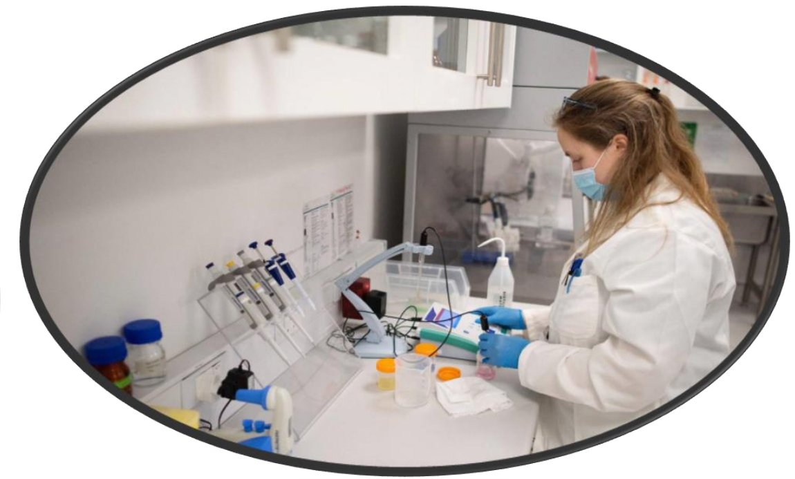
VALORACIÓN DE NUEVOS TRATAMIENTOS