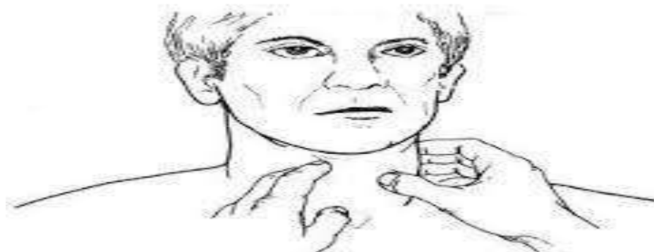
Fig. 4.21 Palpación de los lóbulos por la técnica de Lahey.

En la zona posterior se tiene la columna cervical que se explora así: con el pulpejo del dedo índice se identifican las apófisis espinosas de las vértebras cervicales; la más prominente, la séptima cervical, sirve de referencia límite entre el cuello y el tórax, y a partir de allí se cuentan las vértebras dorsales.