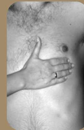
Palpación del latido cardíaco